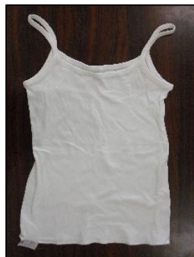
(参考)キャミソール