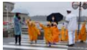
低学年 交通安全教室

4月15日（金）に低学年は、入善警察署のおまわりさんからDVDやクイズを交えた交通安全の話を聞き、交通ルールを守ることを約束しました。その後、小雨の中でしたが実際に道路を歩き、横断の仕方を確認しました。