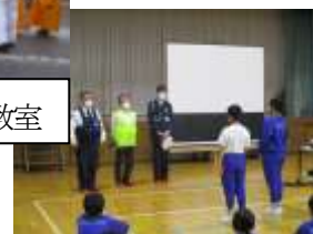
中・高学年 自転車交通安全教室

4月25日（月）に中・高学年は、自転車の乗り方を確認しました。また、翌日には、入善警察署や黒東交通安全協会の方々から自転車の乗り方について話をいただきました。各家庭でも交通ルールについて話し合われて、約束を決めていただきたいと思います。