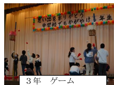
3年 ゲーム 6年生にチャレンジ