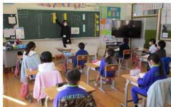
2年 国語科 「ようすをあらわすことば」