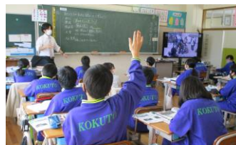
5年 社会科 「わたしたちの生活と環境」