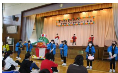
2年 プレゼントわたし エール〜WAになっておどろろ〜