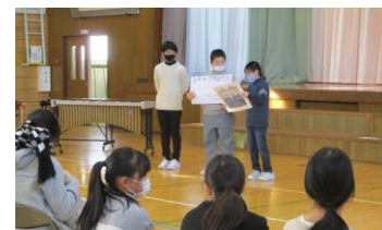
6年 音楽科 「ありがとうコンサート」