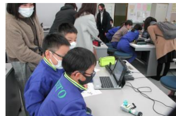
3年 総合的な学習の時間 「プログラミング学習」