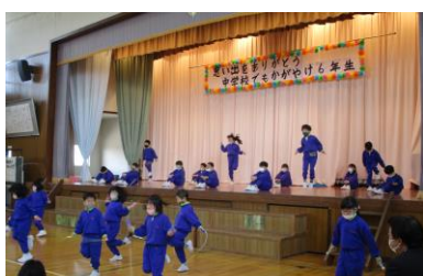
1年 とんで!とんで!! とんで!!!