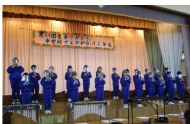
4年 合奏「オーラリー・茶色の 小びん」感謝の気持ちをこめて