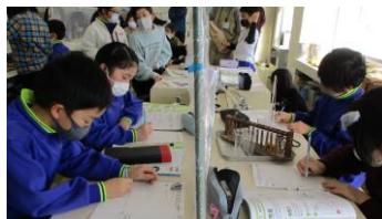
4年 理科 「水のすがたと温度」