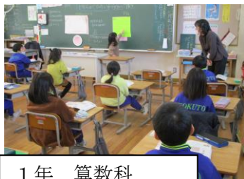
1年 算数科 「どちらがひろい」