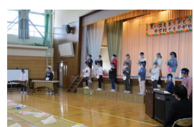
6年 6年生からのおくり物