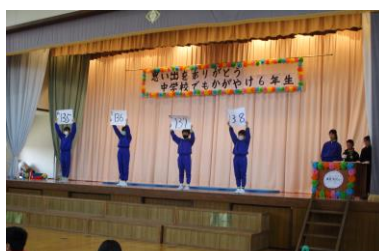
5年 黒東クイズショー